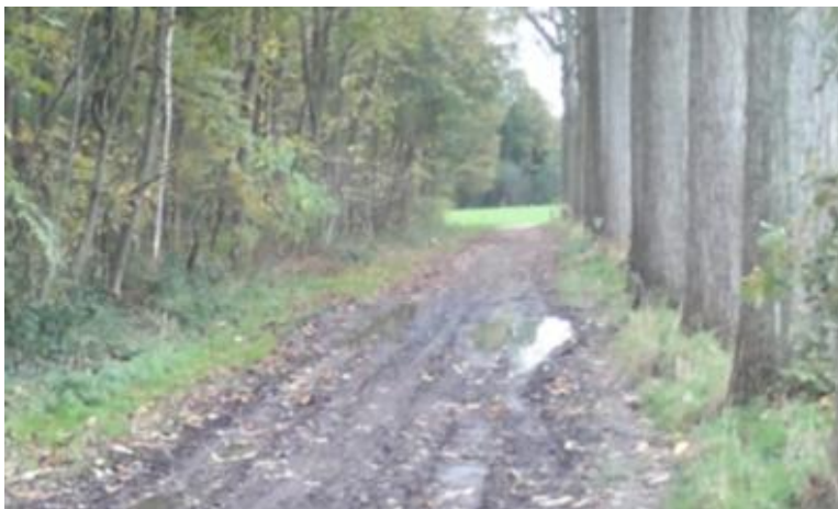
Binnenweg naast de Pannenbossen

Er zijn meerdere Kontichse binnenwegen die erg geleden hebben onder de stevige regenbuien in herfst en winter. Binnenwegen hebben regelmatig onderhoud nodig.