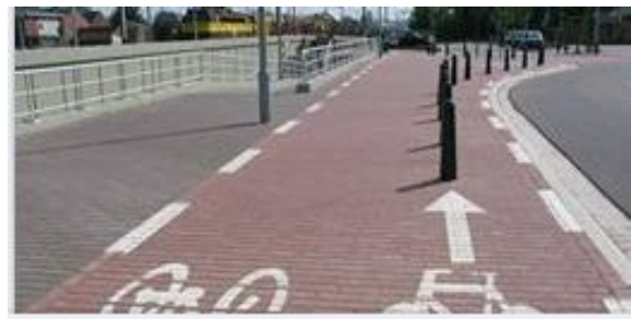
Wat doet dat paaltje daar?