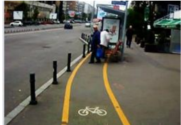
Met fluo lijnen, maar recht op de bushalte.