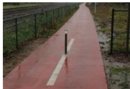
Schilder een volle witte lijn voor en achter elk paaltje.