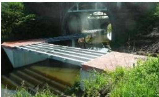
Foto tijdens de aanleg van deze fietsbrug.

Via de fietsostrade Antwerpen-Mechelen fiets je nu al in één rechte lijn van het station Antwerpen Centraal naar dat van Sint-Katelijne-Waver. Op het aansluitende traject, tot aan het station Mechelen Nekkerspoel, werkt de aannemer nu op vier locaties. Zo werd er al een nieuwe fietsbrug aangelegd over de Vrouwvliet in Mechelen.