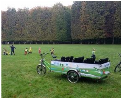
Fietsbus voor Zweede kleuters