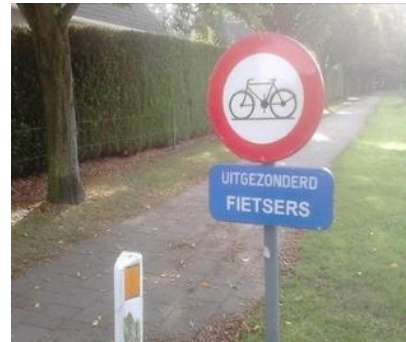
Wie mag er hier fietsen?