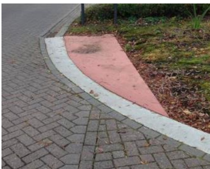
Kortste fietspad in Vlaanderen