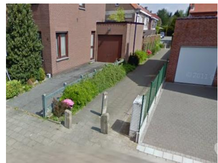
Nutteloze paaltjes op doorsteek van Holle Eikaard naar Konijnenveld

In Nederland vallen er jaarlijks 50 doden en 46.000 gewonden bij eenvoudige fietsongelukken, dat zijn ongelukken waarbij alleen de fietser betrokken is. Bij één op de vier speelt het paaltje een rol. Veel paaltjes staan op een verkeerde plaats of hebben een ongelukkige kleur, zoals bruin of zwart. Bij vele doorsteken zijn ze volkomen nutteloos, gewoon omdat de doorsteek te smal is voor een auto of er al aan de andere kant een paaltje staat. Wij vragen aan het gemeentebestuur een inventaris op te stellen van de bestaande paaltjes en de nutteloze paaltjes zoals aan de doorsteek van de Holle Eikaard naar het Konijnenveld te verwijderen.