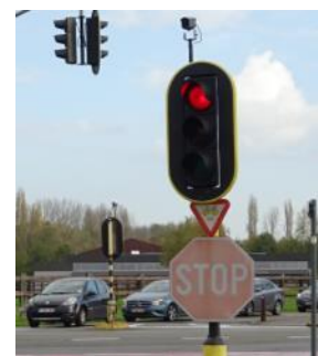
Ook in Neerveld in Kontich

Sinds 2012 mogen fietsers op vele kruispunten in Parijs rechtdoor of rechtsaf door het rood rijden. Sinds 2015 mag het zelfs in alle richtingen, op voorwaarde dat de verkeersveiligheid van de weggebruikers gegarandeerd blijft. Het is de bedoeling de doorstroming voor fietsers te verbeteren, zonder dat ze zichzelf of andere weggebruikers in gevaar brengen. Het principe biedt voordelen: niet alleen de verbeterde doorstroming voor fietsers zelf, maar ook een daling van het risico op dodehoekongevallen en minder gebruik van het voetpad om de lichten te ontwijken.