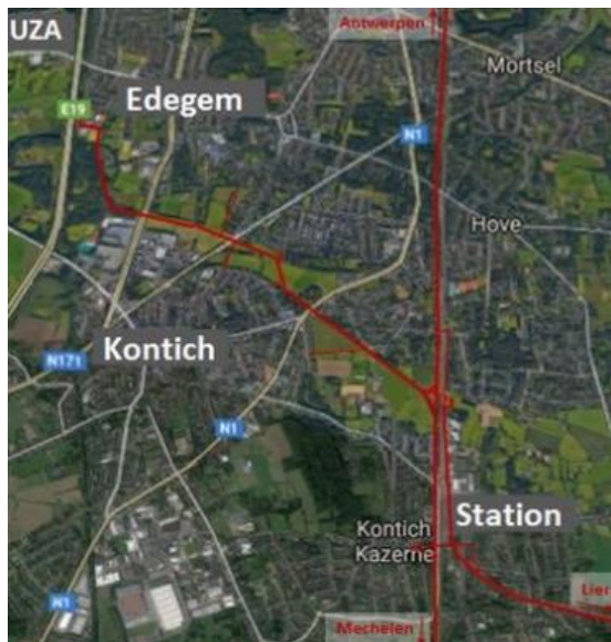
Voorstel voor nieuwe fietsroute Station-UZA.