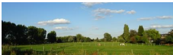
Zone voor mogelijke verbindingsweg

De Fietsersbond vindt dat de open ruimtestrook beter gebruikt kan worden voor een fietsverbinding van het station van Kontich richting UZA .